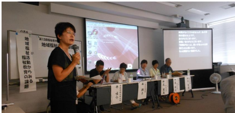
様々な福祉講座・ボランティア講座を企画