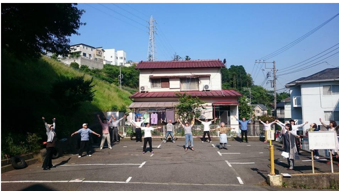
地域で進める支え合いと健康づくりの場