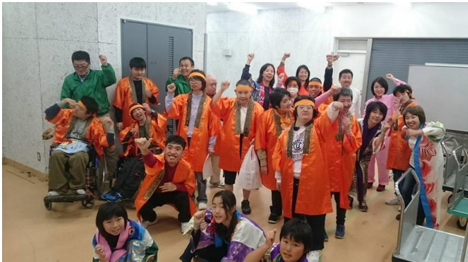
多くの方が協働する生きがいづくりの場