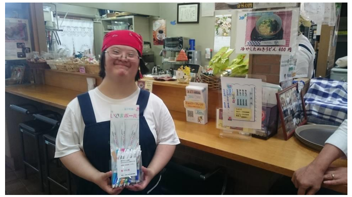
社協グッズ(オリジナル寄付付ボールペン)も販売中です