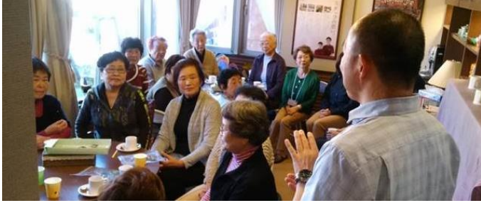
笑顔があふれる集いの場・サロン活動