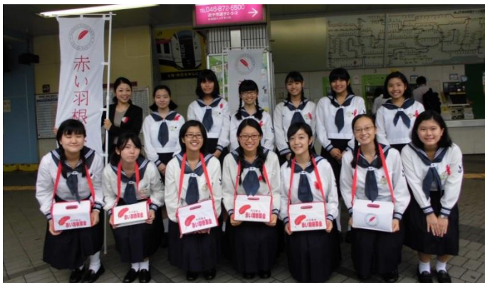
皆様にご協力いただいています 共同募金