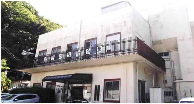
福祉活動拠点 返子市福社会館の運営(指定管理)