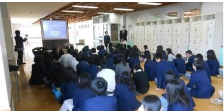
学校での福祉教育に協力