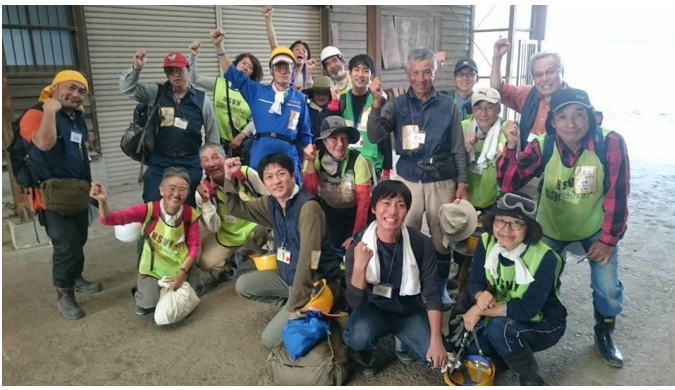
災害時の被災地支援企画も行います(写真は常総市支援)