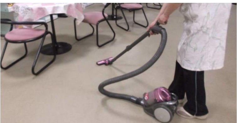
家事援助ヘルパー(フレンドリーヘルパー)の派遣