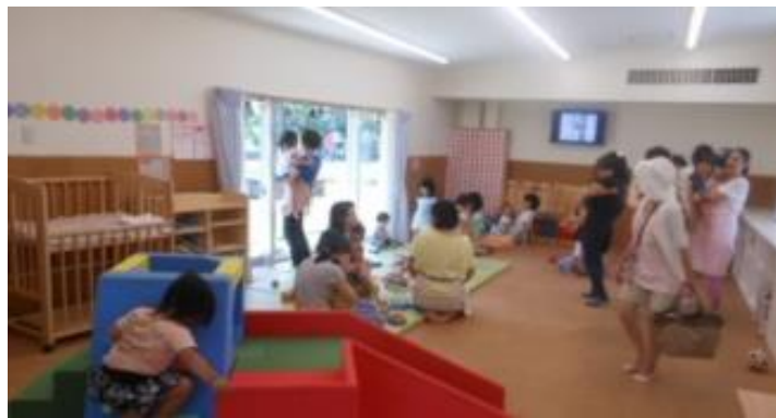
介護保険事業所さくら貝サービス事業所