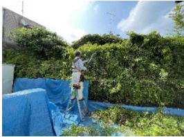
共生'95による福祉課題を抱えた方の草木伐採支援

個人や福祉施設・サロン、そして各ボランティア団体からのニーズに合わせて、ボランティア活動をととした地域づくりを推進しています。