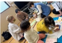
社協 Instagram にてイベント情報配信中

子育て世代を中心とした多世代に向けて、「多世代交流」のイベントや居場所を開催しています。楽しい時間を共有する中で、地域の人同士がつながり、日ごろの挨拶や声をかけやすくなるように、また困った時には助け合えるような関係性づくりを目指しています。