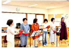
スマイリーZUSHIによる福祉施設やサロン等での手話歌