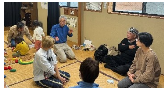
子育て世代の方向士も、地域活動をしているシニア世代ともつながる機会となりました

例えば『亀が岡喫茶室』では、参加したお母さんたちと、スタッフの方が地域情報の交換をする中で、「〇〇がやりたい…」、「〇〇なら協力できるよ…」という会話も聞かれました。子どもたちは、見守ってもらいながら、自由に遊ぶ楽しい時間になったと思います。