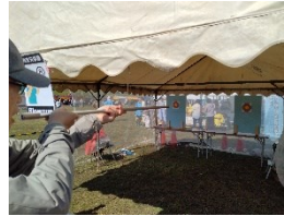
逗子中部健康吹矢同好会による健康増進を目的とした吹き矢体験

ボランティアについてのお問合せは、逗子市社会福祉協議会ボランティアセンターまで。TEL: 046-873-8037