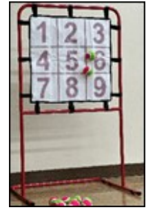
ストラックアウト