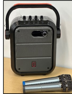
ワイヤレスマイク